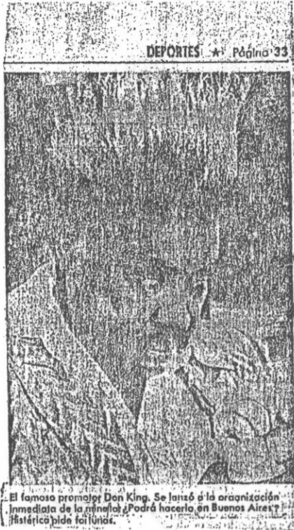
El famoso promotor Don King. Se lanzó a la organización inmediata de la pelea. Podrá hacerlo en Buenos Aires? Histórico pide fallidos.

TROPEZO PERO ME LO CONTARON Cuando bajaba Tropezo Pero me lo contaron