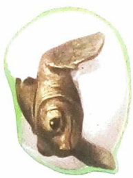
Una pequeña fortuguifo sale del huevo.