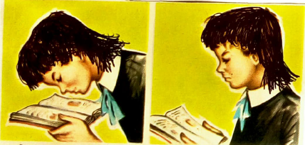
Esta posición es incorrecta.