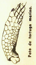
Pata de tortuga marina.