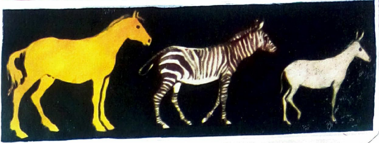
Tres componentes de la familia de los equidos: caballo, cebra y asno.